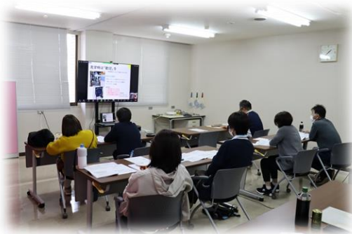
会場とWEBのハイブリッド研修

Zoomを使ったオンライン研修を企画しています。 遠方からでも研修に参加できます。 WEB会議への参加が初めてでも、事務局がサポートしますので、是非ご参加ください。