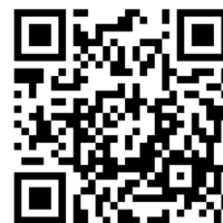
【連絡先情報登録フォーム】

現在は、ホームページやメールなどでお知らせをさせていただいており、メールでのお知らせを御希望の方は、山口県デイ協ホームページ ( https://yg-daykyo.jp/ ) または、QRコードより、「連絡先情報登録フォーム」に必要事項を入力の上、お申込みください。