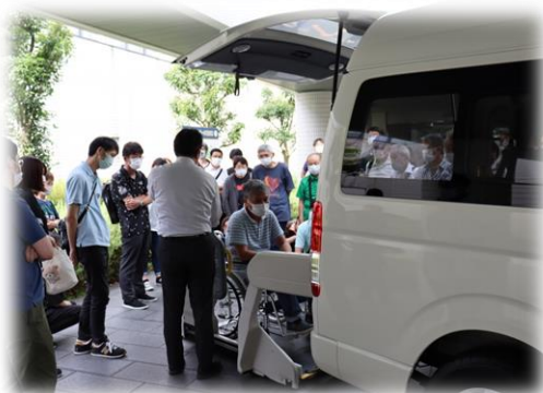
福祉送迎運転者講習会

オンライン研修だけでなく集合研修も企画しています。 直接体験することで実践的な学びを得ることができます。